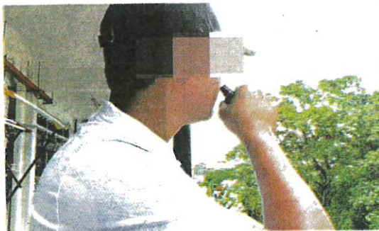
ADA pelajar menggunakan alat penyedut hidung untuk tujuan kesegaran bagi menghilangkan rasa mengantuk dalam kelas. – GAMBAR HIASAN

"Saya tahu tentang produk ini bulan lalu. Bila melihat maklum balas di media sosial, ramai yang cakap ia bagus untuk merawat masalah seperti saya, jadi saya membelinya pada 10