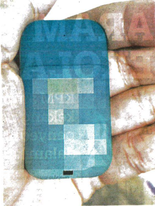
ALAT energy stick digunakan secara meluas dalam kalangan pelajar kerana saiznya yang kecil dan mempunyai pelbagai perisa.