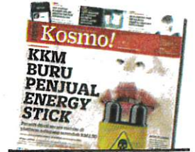
KERATAN Kosmo! 2 Februari 2024.

berpotensi menjerat penggunaannya ke arah penggunaan vape dan dadah pada masa akan datang.